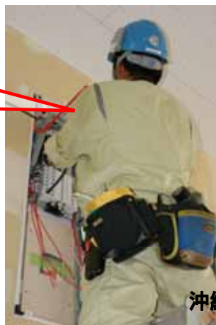
沖縄県 N 様

このチタンラチェット、すごく良いよ！シノが尖っていて使いやすい！やっと巡り会えたヒカリモノだよ！