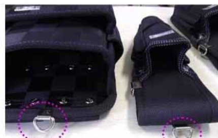
来春 製造分からこのD環で掛けられるように変えて行きます。

このD環は KH 工具袋に従来から使用している落下防止ワイヤーの接続などにお使いいただける丈夫な構造です。順次製造分から対応していきますのでご期待下さい。