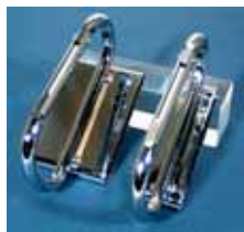
170 / 185 比較写真