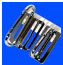
173 / 186 比較写真