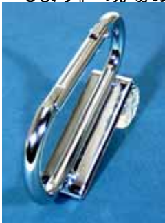
NO, 185 ベルト通し スリムタイプ

「幅があまり広くないスリムなものはないか」「 KH さん、小型タイプを作って欲しい」との職人さんの声により 誕生致しました。 職人さんの腰周りは、安全帯・工具袋・ペンチケース等が有り 新たに 座付き カラビナを付けるスペースも限られているのが現状です。 NO, 185はベルト通しのスリムタイプ、NO,186は2つ穴のスリムミニタイプ。 つける事で より作業効率がアップします。 現場の声から生まれた 新生 KH スリムツールホルダー を宜しくお願いします。