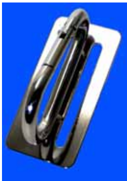
NO, 186 2つ穴 スリムタイプ