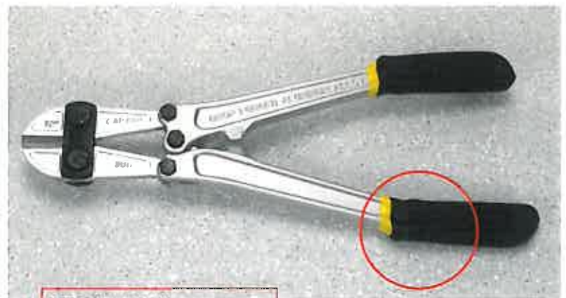
手が疲れないソフトグリップ