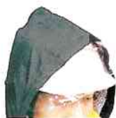
ヘルメットのまま装着可能