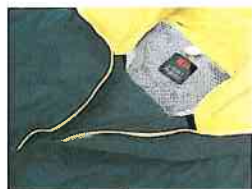
完全水切りの安心設計