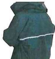
安心の背面反射テープ