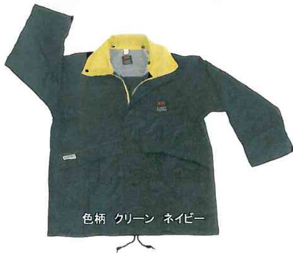
色柄 クリーン ネイビー

ライトパジェロスーツは当社レインスーツの中でも中核を成す 多機能レインスーツです。生地は丈夫で手触りもよく中は総メッシュ仕上げです。カラーも他社には無い美しい配色で仕上がっており価格も大変お求め安くなっております。