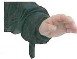
水の浸入を防ぐ袖口